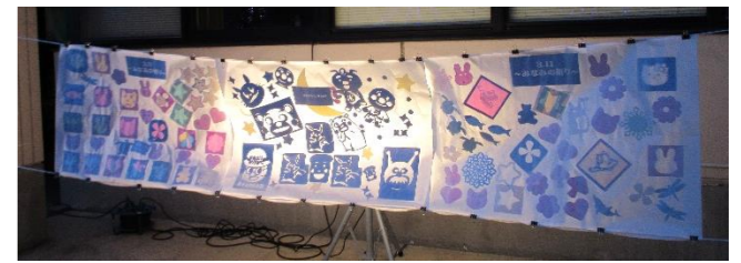
影絵:地区民のみなさん