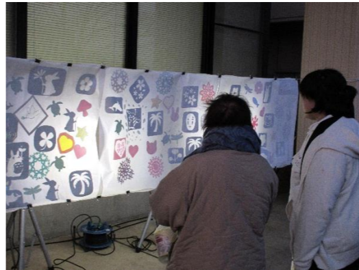
切り絵協力:「ほっと♡ひろば」さん