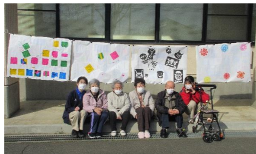
切り絵協力:「あおぞら」さん

3月11日(水)東日本大震災から15年。今年は16:00~「棒パン(パン生地を竹に巻き付けて焼く)」をし、17:00~切り絵を飾り、ライトアップさせると影絵が浮かび上がりました。その後、黙祷を捧げました。追悼花火は風が強かったため、中止になりましたが、イルミネーションを点灯し、来場者で、震災の記憶を語り継ぎ、日々の生活に感謝すること。そして、自らの命を守る防災の意識を持つこと。この節目に、一人ひとりが「今自分にできること」を深く考える貴重な時間となりました。募金は、10,723円集まり、日本赤十字岩手支部へ託しました。ご協力ありがとうございました。